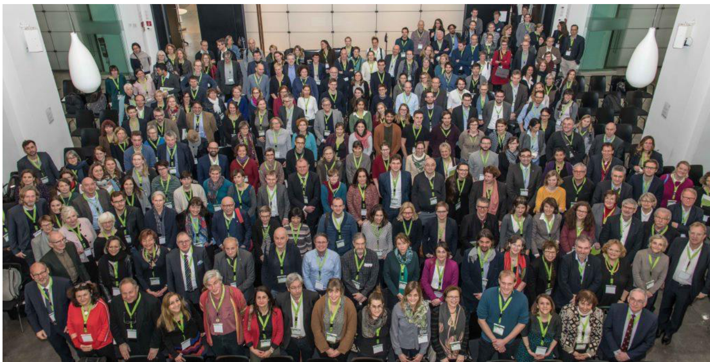
Die Teilnehmenden des dritten Symposiums. Weitere Impressionen der Veranstaltung sind auf unserer Website zu finden

Die Ergebnisse des Symposiums fließen in die Erarbeitung der Public-Health-Strategie ein. Einige Arbeitsgruppenergebnisse werden gesondert publiziert.